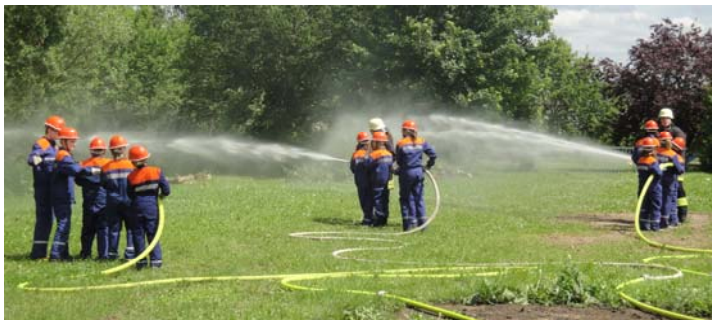
Die Jugendfeuerwehr bei einer Übung

All dies sind die Aufgaben, die sich jedermann unter einer Feuerwehr vielleicht vorstellt. Doch ist dies schon alles? Nein natürlich nicht. Als nächster großer Bestandteil der Feuerwehr Queckborn ist die Jugendfeuerwehr zu nennen. Sie ermöglicht es den Kindern ab 6 Jahren spielerisch die Gefahren mit dem Feuer kennenzulernen. Auch der Sport und der Teamgeist wird bei der Jugendfeuerwehr Queckborn gefördert. Es gilt das Motto „mit Spiel und Spaß Technik live erleben“. So gibt es nicht nur Theorie und Praxisabende, sondern es werden auch Zeltfreizeiten, Berufsfeuerwehrtage, DVD- Abende und Spielabende veranstaltet. Des Wei-