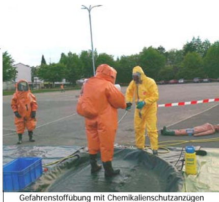
Gefahrenstoffübung mit Chemikalienschutzanzügen

manchen Stadt- und Kreiswettkämpfen als Sieger heimgekehrt. Die Jugendfeuerwehr besteht derzeit aus 15 Kindern und Jugendlichen und trifft sich immer montags ab 17:30