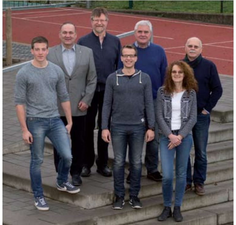
Kandidaten Ortsbeirat Grünberg